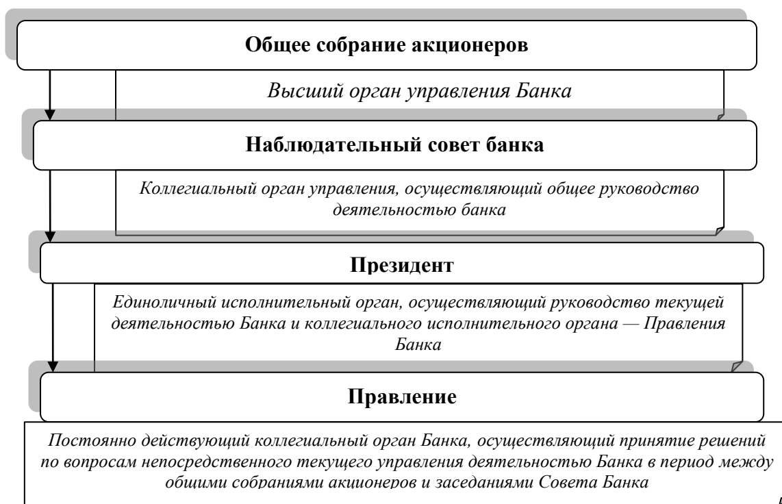
Рисунок 1 – Органы управления ПАО «XXX»

Далее дается оценка экономических условий деятельности коммерческого банка. Оценка проводится на основании взаимосвязанных и взаимодополняемых данных, представленных в таблицах, рисунках.